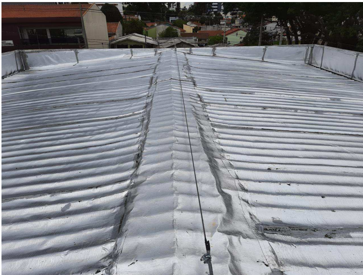
Telhas impermeabilizadas na cobertura do depósito de urnas

O depósito de urnas já recebeu impermeabilização pré-eleições 2020, em caráter emergencial, devido as infiltrações que estavam ocorrendo no local. O serviço foi bem realizado e não houve mais infiltrações até essa data. A solução de impermeabilizar as telhas está sendo eficaz, sanando os problemas de infiltração. Segue foto abaixo do serviço realizado, impermeabilizando juntamente a calha, com o intuito de não haver transbordo de água pluvial em caso de entupimento.