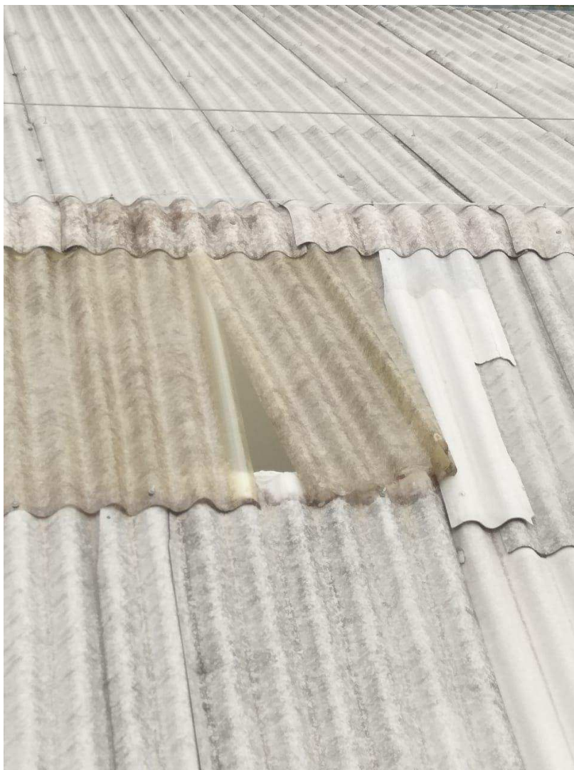
Telha translúcida com quebra nas pontas e solta