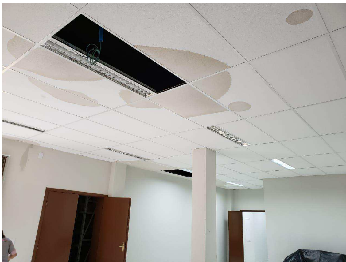
Alagamento na sala multiuso em razão do transbordamento da calha