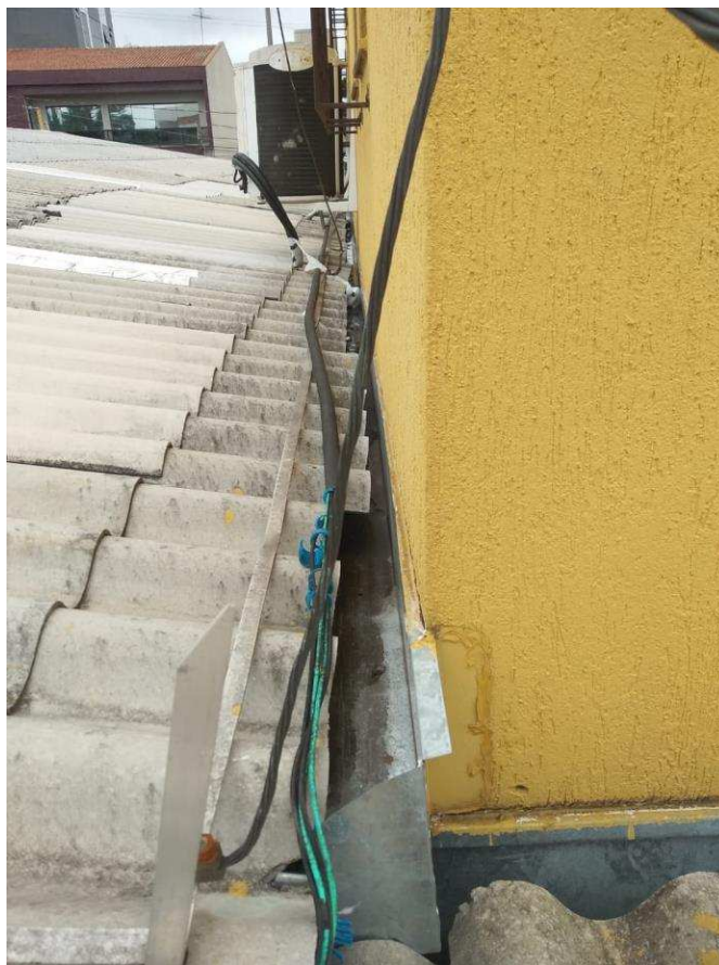
Espaçamento entre telha e alvenaria inexistente – Telhas desalinhadas

Junto com o depósito de urnas foi solicitado a impermeabilização da calha da ampliação do fórum, porém não foi possível a execução do serviço, pois não há espaçamento suficiente para realizar o serviço na calha, conforme foto abaixo: