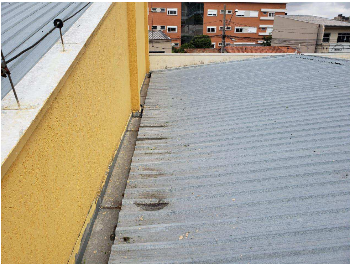
Cobertura do cartório 008