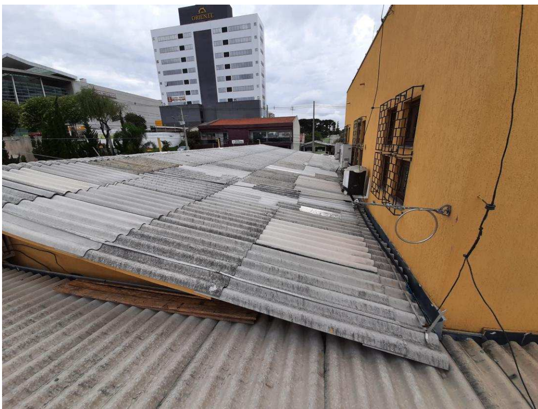
Cobertura da ampliação da edificação pode ser visto da rua

Como esse telhado da ampliação do fórum não é embutido em platibanda não há possibilidade de impermeabilizá-lo inteiramente, por questão estética, visto que é possível ver o telhado da rua em frente a edificação.