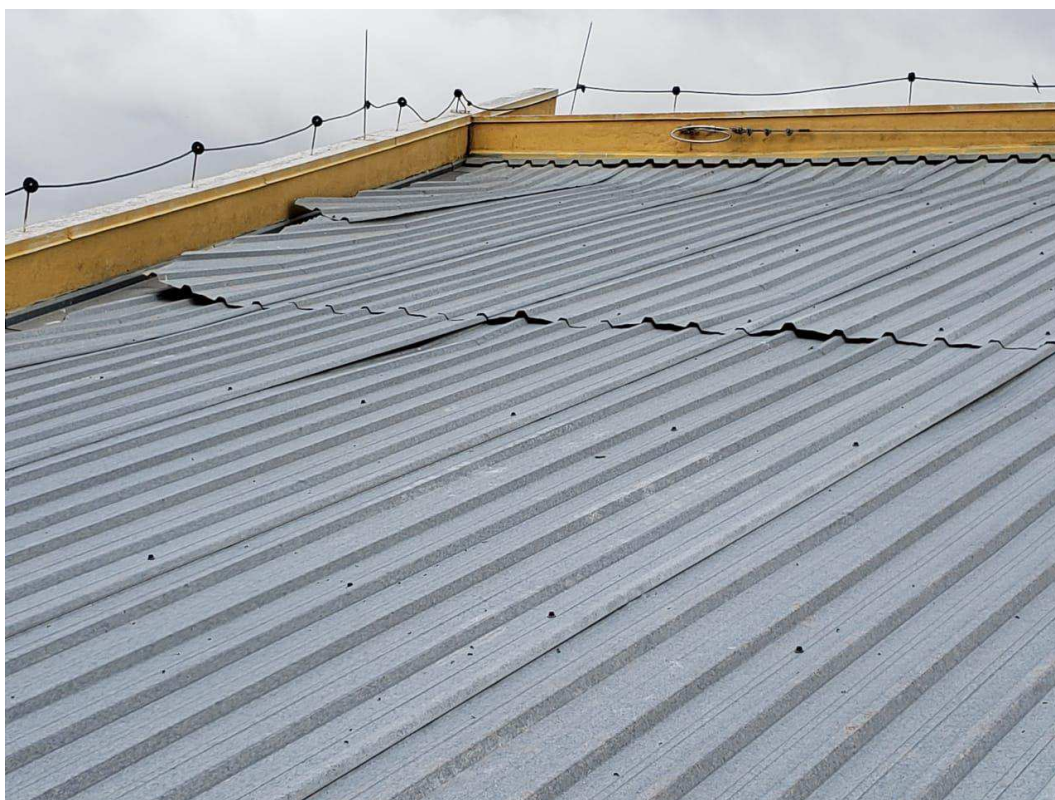
Cobertura da CAE