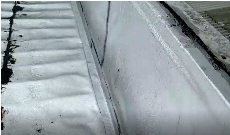
Calha impermeabilizada na cobertura do depósito de urnas