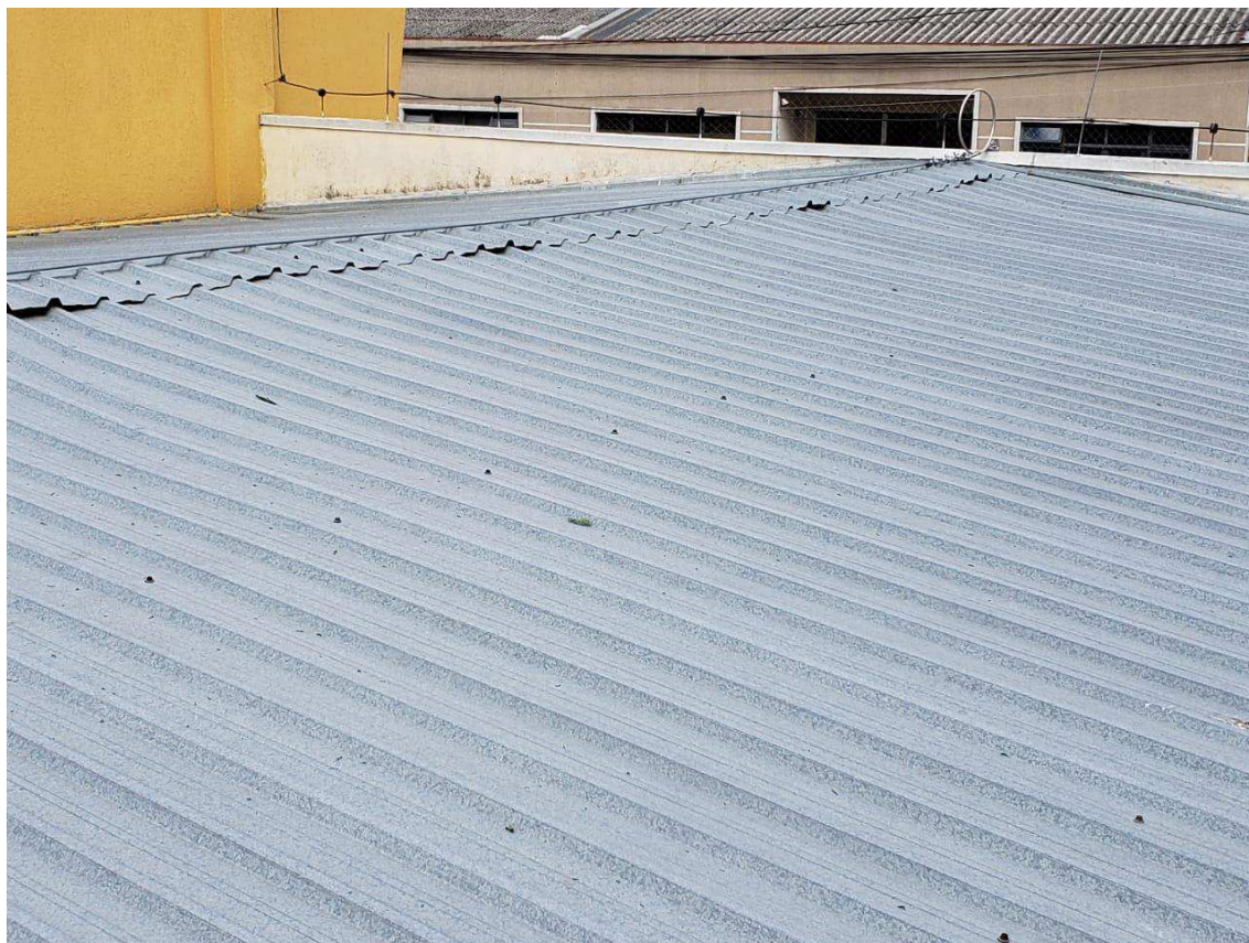
Cobertura do cartório 008